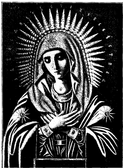
Икона Богоматери Умиленія, предъ которою скончался преп. Серафимъ.