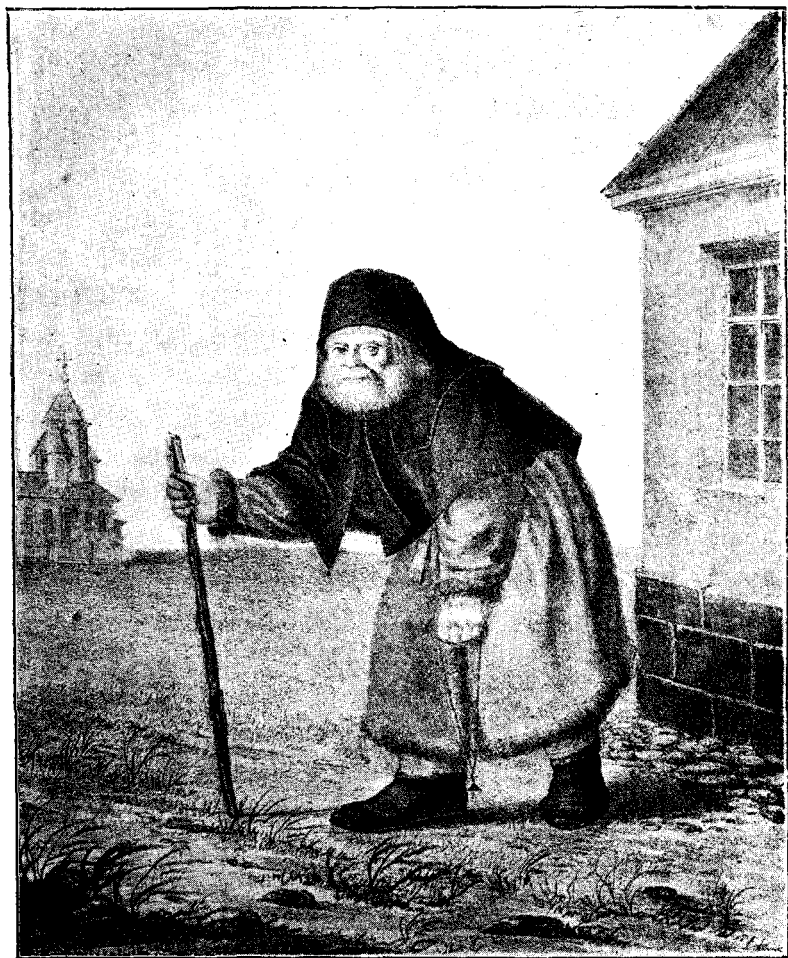
Изображеніе преп. Серафима. (Со старинной гравюры).