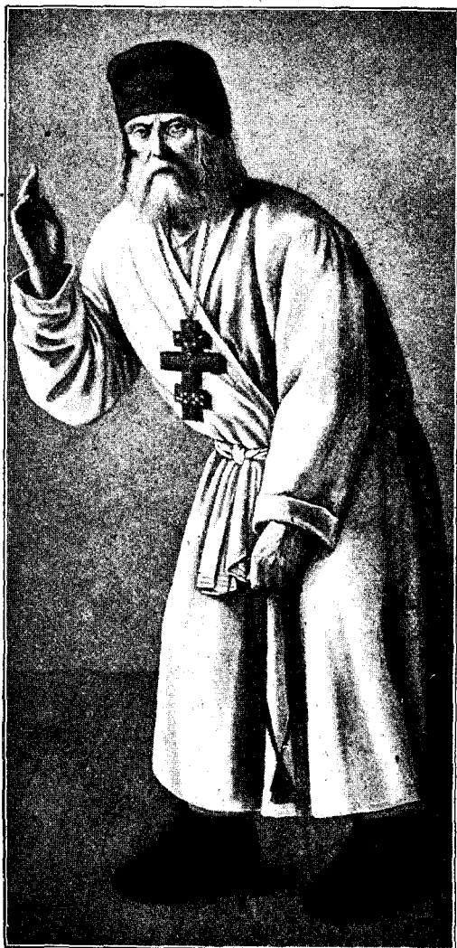
Великій старець Серафимъ Саровскій.