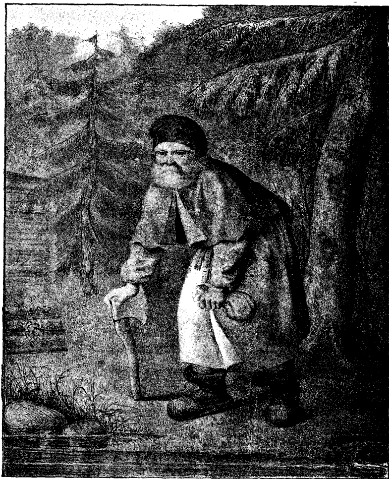
Изображеніе преп. Серафима. (Со старинной гравюры).