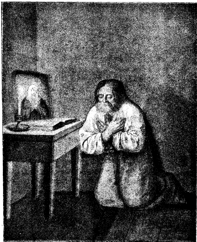
Кончина преп. Серафима. (Со старинной гравюры).